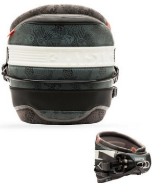
Harnais ceinture Mystic drip ou autre en taille XL, voir XXL : 119 e TTC