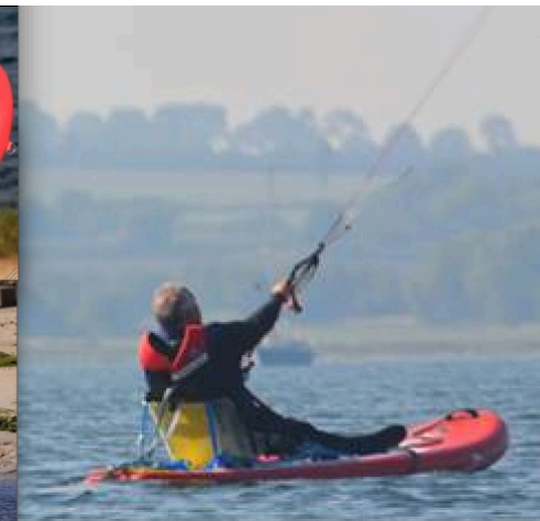
Sroka SUP 9.9 « For All » pour initiation au kite : 654 e TTC livré Rajouter un siège baquet avec sangles de fixation et une mousse Biosoft anti escarre : 200 e TTC